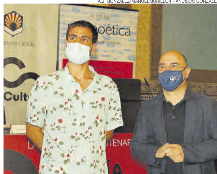
► Lectura de poemas de García Baena en la UCO.